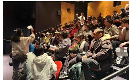
小学校でのトントン相撲