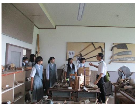
郷土資料館の見学