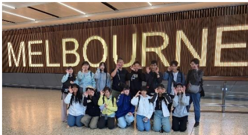
よさこいワークショップ